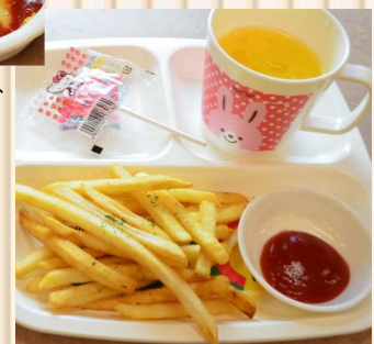
ポテト・ドリンクバーが全品に付いています♪