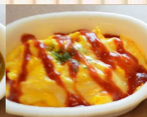
お子様オムライス