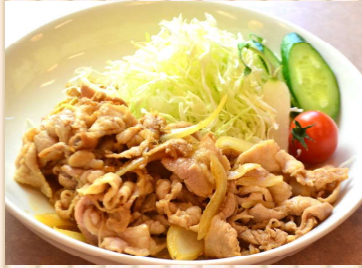
自家製タレの生姜焼き